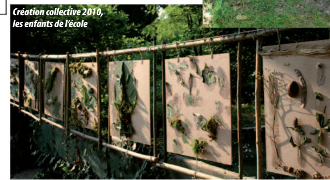
Création collective 2010, les enfants de l'école

Art et handicap , qu'est-ce que créer ? Rencontre et projection de films avec Résonance contemporaine